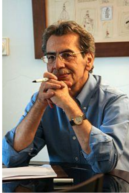
استاد کامبیز درمبخش ، کاریکاتورست بزرگ ایرانی و