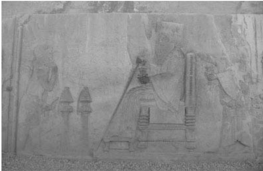
نقش برجسته داریوش بزرگ شاهنشاه هخامنشی در پرسپولیس