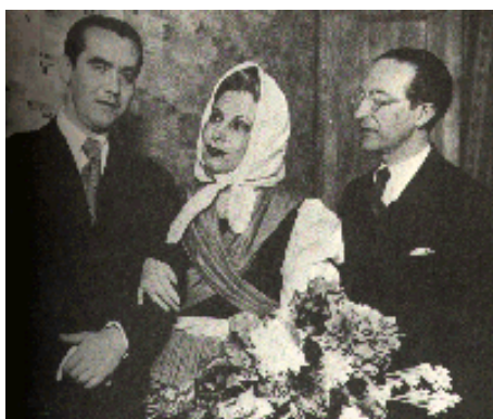
In 1934 with the actress Margarita Xirgu, who had just starred in the first performance of Yerma, there revolutionary play which was to earn Lorca the hatred of Catholic middle-class Spain.