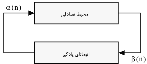
شکل (۲): ارتباط اتوماتای یادگیر با محیط

در روش پیشنهادی هر سنسور در شبکه مجهز به یک اتوماتای یادگیر می‌باشد. وظیفه این اتوماتای یادگیر ویا افزایش ناحیه ارسال برای فرستادن پیغام توسط گره می‌باشد. این اتوماتای یادگیر دارای r عمل \{\alpha_1, \alpha_2, \dots, \alpha_r\} می‌باشد. هر عمل در این مجموعه نشان‌دهنده مقدار افزایش و یا کاهش اندازه ناحیه ارسال می‌باشد. اتوماتای یادگیر گره‌ای که چندپخشی متحرک را آغاز می‌کند، یکی از اعمال خود را بر طبق بردار احتمالات اعمال انتخاب می‌کند. برای گره شروع کننده چندپخشی متحرک احتمال انتخاب همه عمل‌ها یکسان می‌باشد. عمل انتخابی با شعاع ناحیه ارسال جمع شده تا اندازه جدید ناحیه ارسال بدست آید. آنگاه گره با قراردادن تعداد همسایگان پیش‌روی و عمل انتخابی خود، در سربند پیغام 2^9 ، پیغام را چندپخشی