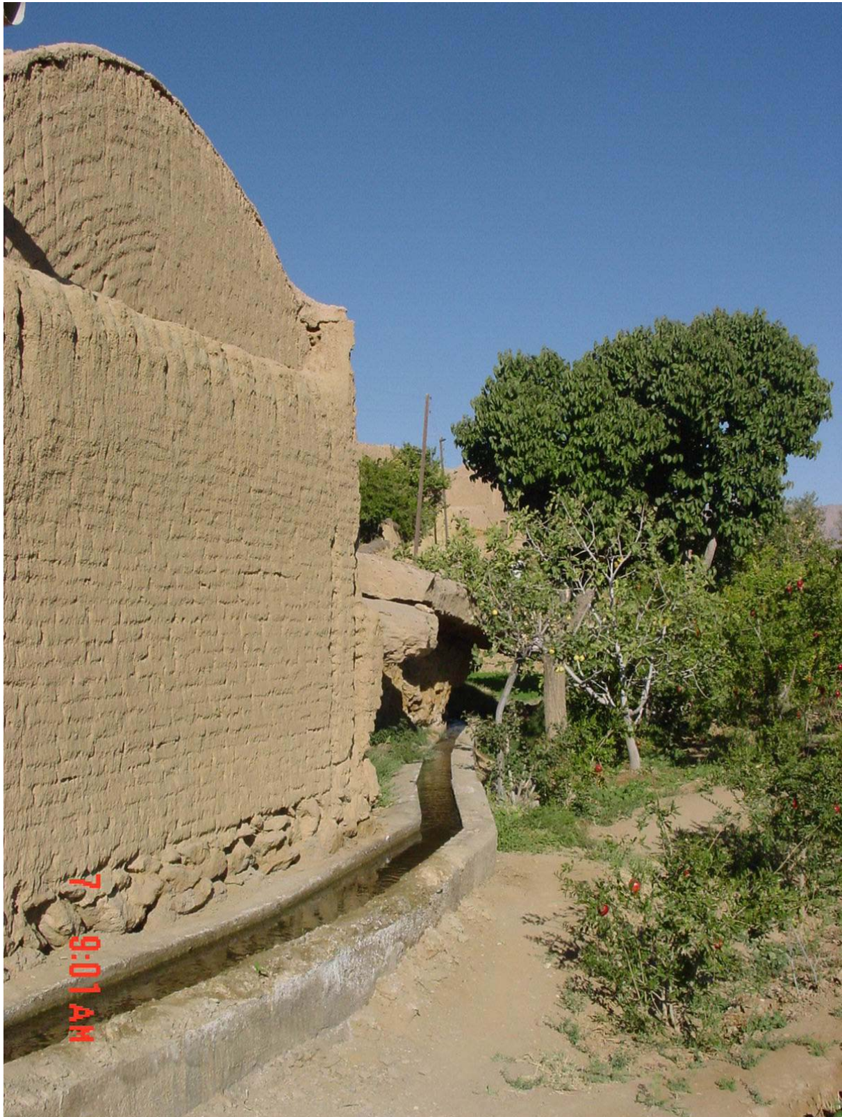
زیست بوم خرانق - ( تقوائی - ۱۳۸۲ )